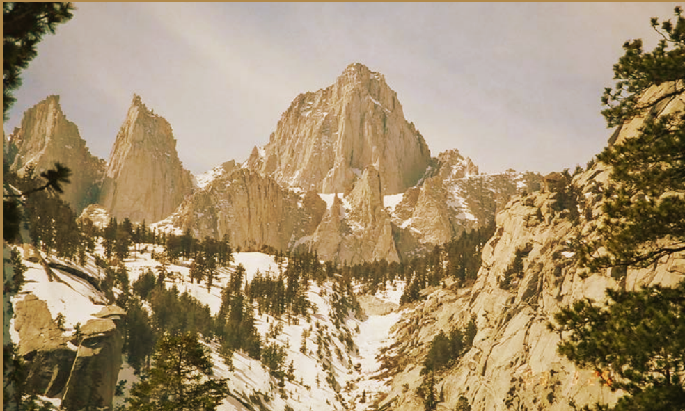
Mt Whitney, der höchste Berg der kalifornischen Sierra Nevada