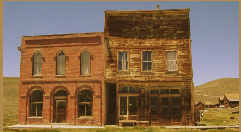
Verlassene Bergarbeiterstadt Bodie, Kalifornien