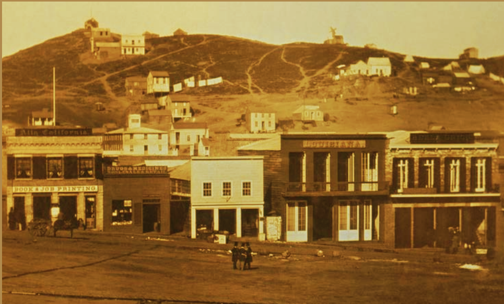
Portsmouth Square in San Francisco, 1851