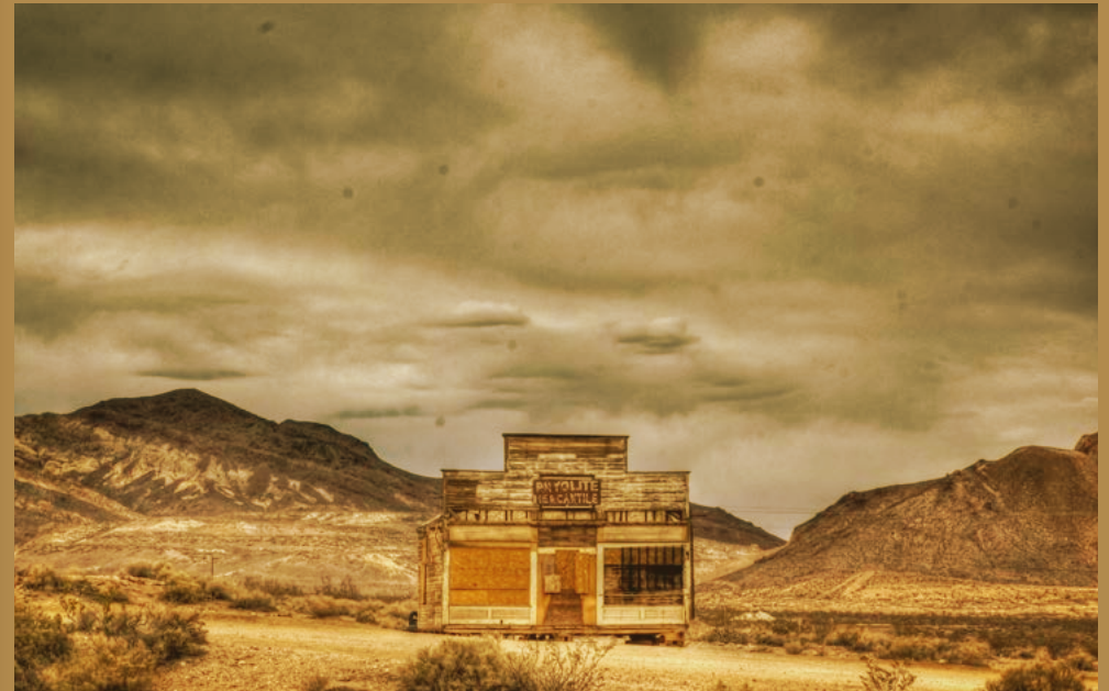
Verlassene Bergarbeiterstadt Rhyolite, Nevada