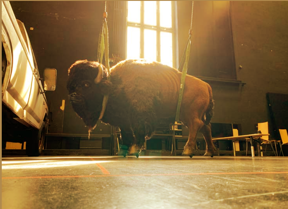
Ankunft von Bison Juanita auf der Seitenbühne der Staatsoper Unter den Linden