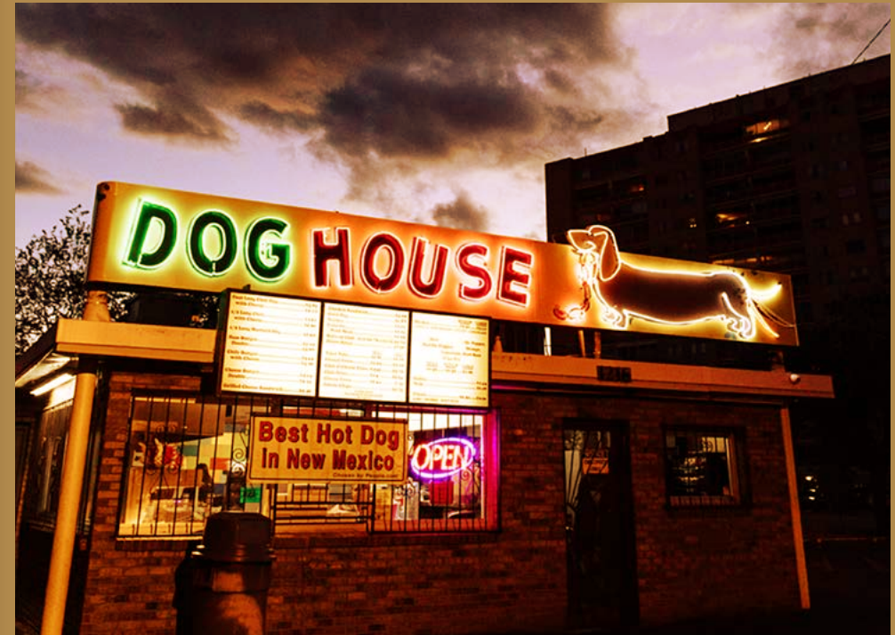
»Dog House« in Albuquerque, New Mexico, einer der Schauplätze von »Breaking Bad«

L S Ich würde mir wünschen, dass sich die Zuschauer:innen in diesen letzten Momenten fragen, zu welcher Seite sie gehören würden: zu denen, die eine Chance auf einen Neubeginn verdient haben, oder zu denen, die im System gefangen bleiben?