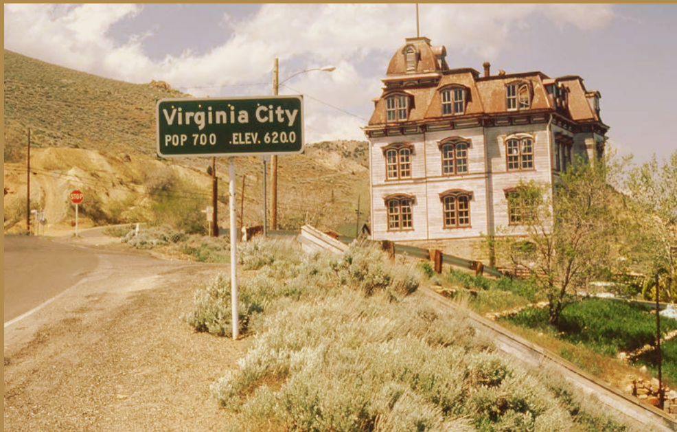
Geisterstadt Virginia City, Nevada, mit dem Piper's Opera House