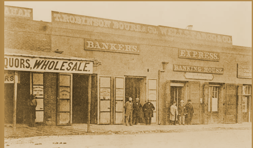
Bankhaus von Wells Fargo and Co. in Stockton, Kalifornien, um 1860