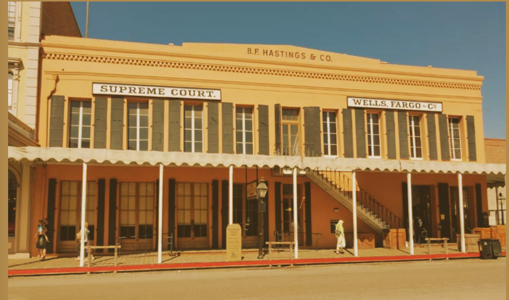
Terminal des Pony Express in Sacramento

WELLS FARGO Agent Ashby aus der Oper repräsentiert einen der historisch prägendsten Konzerne, die bis heute in San Francisco ansässige Bank Wells Fargo. Nach der Gründung 1852 in Des Moines, Iowa, weitete das Unternehmen seine Aktivitäten auf den neuen Westen aus. Dort bot es lange Zeit fast konkurrenzlos neben Finanz- vor allem Post-, Transportdienste und Personenverkehrsverbindungen mit Kutschen an – also plausibel, dass es auch Agenten beschäftigte, die für die Sicherheit der Strecken sorgen sollten.